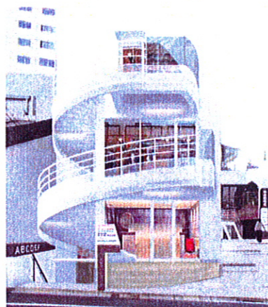
イメージ①建物正面