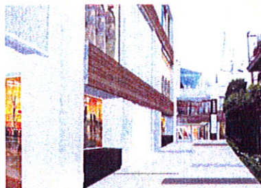
イメージ②路地方向