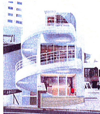
イメージ①建物正面