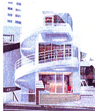
イメージ①建物正面