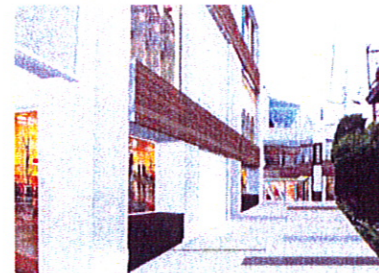
イメージ②路地方向

物 件 名 : ROOB II 所 在 地 : 東京都渋谷区猿楽町24-1 交 通 : 東急東横線「代官山駅」徒歩4分 構 造・規 模 : RC造・地上3階、地下1階 竣 工 : 1991年4月竣工、2008年8月リノベーション完了 現 況 : 入居中 契 約 : 普通賃貸借契約2年 入 居 日 : 9月中旬以降 用 途 : 店舗 面 積 : B1F 76.02坪 賃 料 : ご相談 共 敷 費 : 賃料に含む 設 備 金 : 10ヶ月(償却なし) 備 考 : なし。スケルトン渡し。 考 : 火災保険加入義務あり 仲介手数料_賃料の1ヶ月相当分